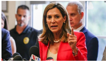
La legisladora federal María Elvira Salazar, del Distrito 27 de la Florida, durante en una conferencia de prensa en Hialeah Gardens el 5 de agosto de 2021.

Una audiencia en el Congreso sobre el emergente sector privado en Cuba el jueves expuso las divisiones políticas entre republicanos y demócratas sobre la política hacia Cuba, con la congresista de Miami María Elvira Salazar encabezando la acusación contra estas empresas, calificándolas de ser “una artimaña del gobierno”.