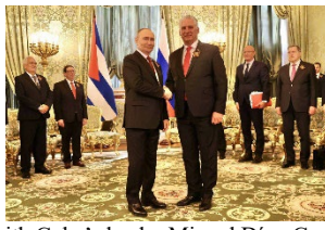
Russia's President Vladimir Putin (left) in a meeting with Cuba's leader Miguel Díaz-Canel on May 9 in Moscow.

The days when the island received billions of rubles in Soviet subsidies are long gone, as Russia is under heavy sanctions by Western nations and involved in an expensive war.