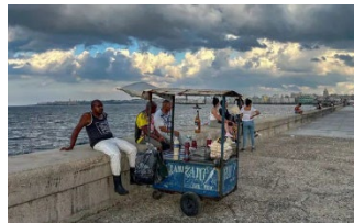
La Cuba comunista se encuentra al borde del colapso Estados Unidos al igual que Latinoamérica tiene fuertes razones para no renunciar a una Cuba moderna.

En un acontecimiento que pasó casi desapercibido en medio de los dramas y las crisis que golpean a América Latina cada semana, los últimos días de febrero el Gobierno cubano pidió ayuda a las Naciones Unidas para abordar una creciente escasez de alimentos.