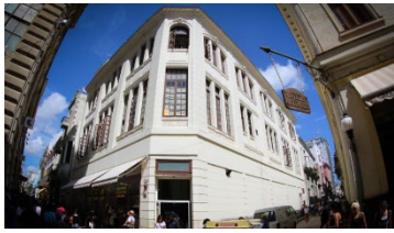
A former Woolworth's store which is now used as a "10 Cent Store", the equivalent of a dollar store in the United States.