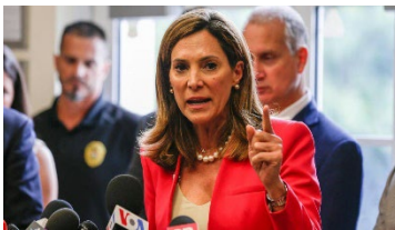
U.S. Rep. Maria Elvira Salazar, of Florida's 27th Congressional District, during a press conference in Hialeah Gardens on Aug. 5, 2021.

A congressional hearing Thursday about Cuba's emerging private sector exposed the political divide between Republicans and Democrats on Cuba policy, with U.S. Rep. María Elvira Salazar, a Cuban American from Miami, leading the charge against the enterprises, calling them “a government ruse.”