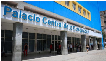
The former Sears Roebuck and Co. in Havana is now a computer center for Cubans to use the internet.