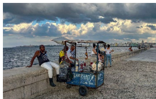
Waiting for a better future.