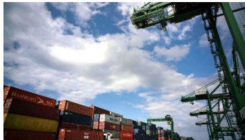
Most cargo shipments from the United States go to the Port of Mariel, west of Havana. Most cargo shipments from the United States go to the Port of Mariel, west of Havana.

In a surprising development given Cuba’s worsening economy, exports of food and other goods from the United States were up last year thanks to an explosion of trade involving private small and medium enterprises on the island.