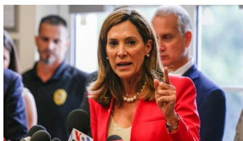
La legisladora federal María Elvira Salazar, del Distrito 27 de la Florida, durante en una conferencia de prensa en Hialeah Gardens el 5 de agosto de 2021.

Una audiencia en el Congreso sobre el emergente sector privado en Cuba el jueves expuso las divisiones políticas entre republicanos y demócratas sobre la política hacia Cuba, con la congresista de Miami María Elvira Salazar encabezando la acusación contra estas empresas, calificándolas de ser "una artimaña del gobierno".