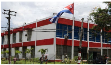
The former Coca-Cola building in Havana, ironically painted the company colors. The Building now houses the headquarters of the state-owned “Beverage Company of Havana”.

Castro didn’t nationalize just American property; he seized all private property. Every home and every business became the property of the government, and none of the owners were paid for them. With few exceptions, that is still true today.