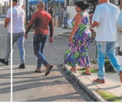
Un grupo de personas sentadas en un espacio público en Cuba.

Desde 1960, el embargo de Estados Unidos restringe el comercio y las relaciones con Cuba, con el objetivo de presionar al Gobierno cubano para promover cambios políticos y económicos. La Administración de Obama trató de revertirlo, dando el embargo por fallido. Trump impuso más aperturas.