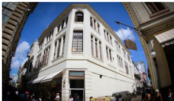
A former Woolworth’s store which is now used as a “10 Cent Store”, the equivalent of a dollar store in the United States.

There are nearly 6,000 American claims to property and land in Cuba, all of it seized by Fidel Castro’s government after his 1959 coup d’etat. The value of the claims totals more than $7 billion , and many are held by major U.S. brands like Pepsi, General Electric, and Twentieth Century Fox.