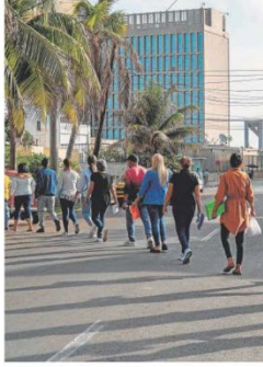
Cuba en la embajada de EE.UU. en La Habana.

Grandes empresas como Meliá hacen negocios en Cuba, pero siempre con el régimen, que controla el sector del turismo