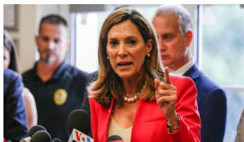
U.S. Rep. María Elvira Salazar, of Florida's 27th Congressional District, during a press conference in Hialeah Gardens on Aug. 5, 2021.

A congressional hearing Thursday about Cuba's emerging private sector exposed the political divide between Republicans and Democrats on Cuba policy, with U.S. Rep. María Elvira Salazar, a Cuban American from Miami, leading the charge against the enterprises, calling them "a government ruse."