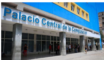
The former Sears Roebuck and Co. in Havana is now a computer center for Cubans to use the internet.