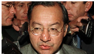
File photo of former US ambassador to Bolivia, Manuel Rocha, talking to the press on the 11th of July 2001.

The recordings suggest Rocha was recruited by the Cubans in Chile in the 70s and may have become a State Department employee expressly to become a covert agent. In the FBI recordings, he says his well-known right-wing persona was part of his cover.