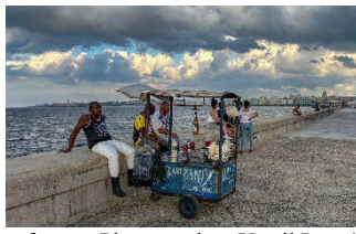
Waiting for a better future.

Almost unnoticed amid the drama and crisis that hit Latin America every week, in the last days of February the Cuban government asked the United Nations for aid to address a growing food shortage.